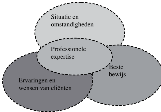
Figuur 1 Zorgvuldig opgezet evidence based onderzoek. Bron: Haynes, Devereau et al. 2002.

Een zorgvuldig opgezet evidence based onderzoek houdt overigens rekening met juist die omstandigheden, die persoonlijke invloeden van hulpverleners en cliënt. Het houdt ook rekening met de ervaringen van de cliënt en met diens wensen (Haynes, Devereau et al. 2002)(figuur 1).